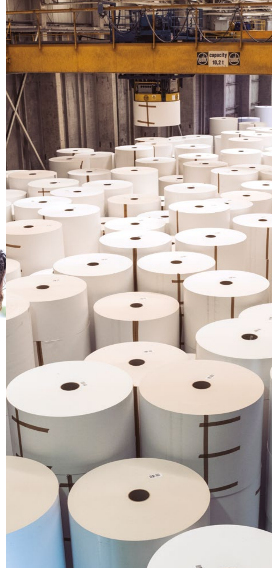
CMPC Cartulinas, Planta Maule

A continuación, te presentamos nuestro Reporte de Sostenibilidad 2018, cuya información e indicadores principales se organizan en relación a cuatro acciones fundamentales de nuestro desempeño: Cultivar, Vincular, Operar y Solucionar.