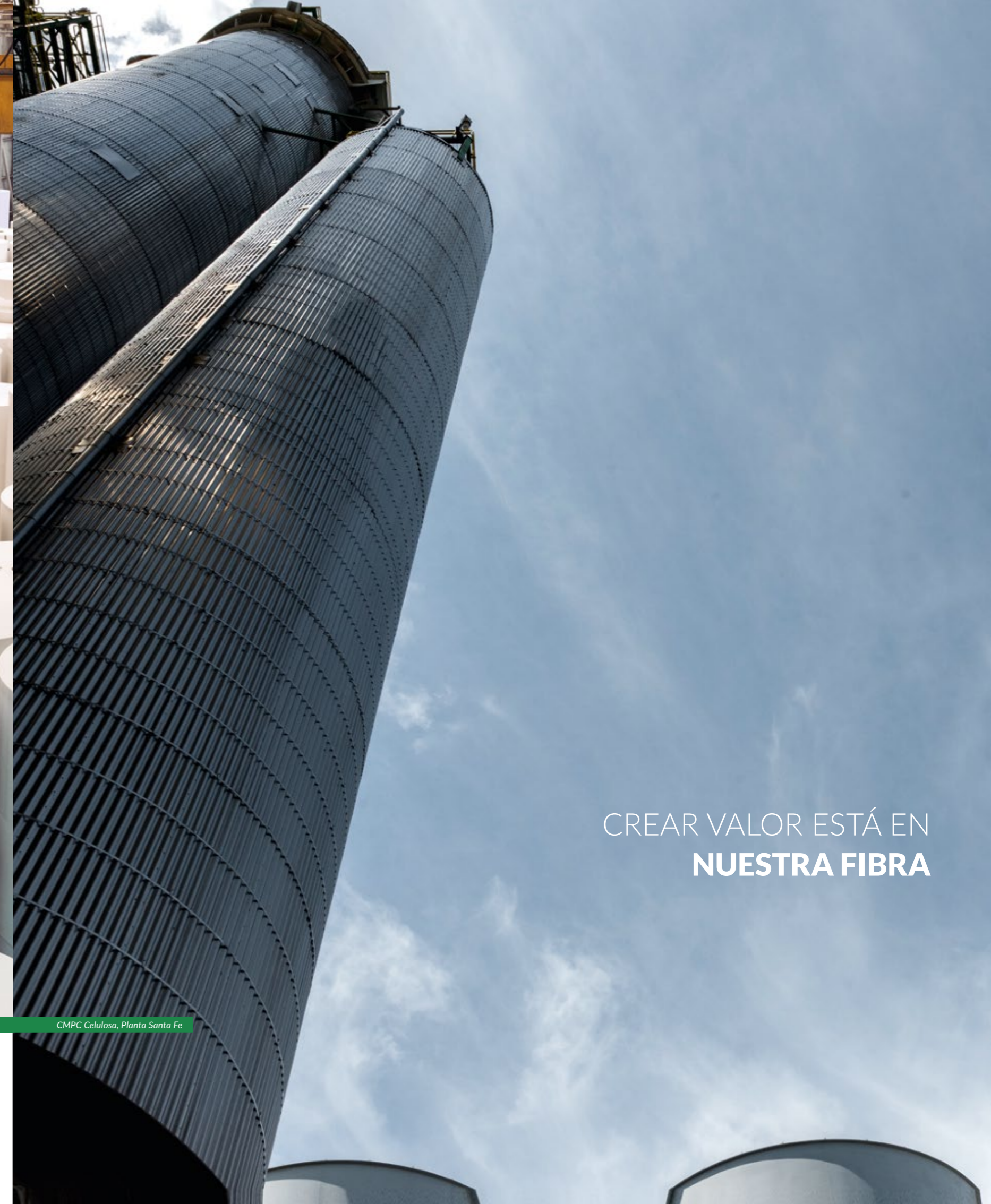
CMPC Celulosa, Planta Santa Fe

Para mayor información visita nuestra Página Web y Reporte Integrado 2018 en: